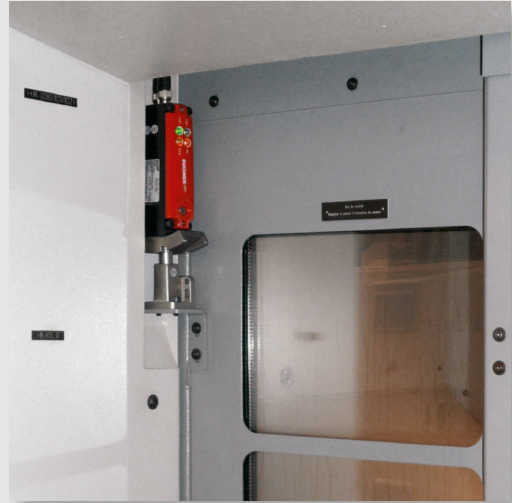
Sécurisation d'une porte coulissante