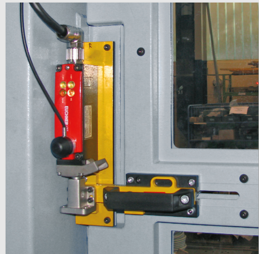
Sécurisation d'une porte battante

EUCHNER GmbH + Co. KG Kohlhammerstraße 16 D-70771 Leinfelden-Echterdingen Allemagne